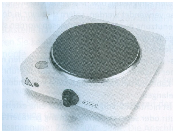
Elektrická kuchyňská jednoplotýnka